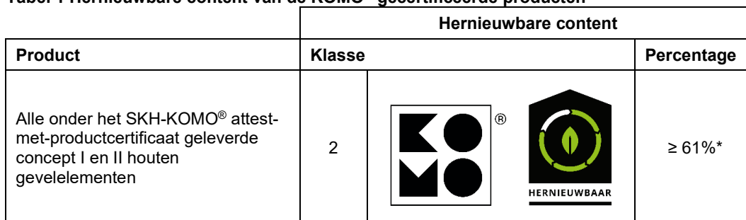
Tabel 1 Hernieuwbare content van de KOMO ® gecertificeerde producten

* gebaseerd op kozijnen en ramen vervaardigd met uitsluitend houten dorpels en stijlen, exclusief vakvulling.