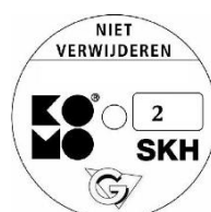
geschikt voor weerstandsklasse 2