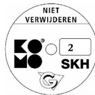
geschikt voor weerstandsklasse 2